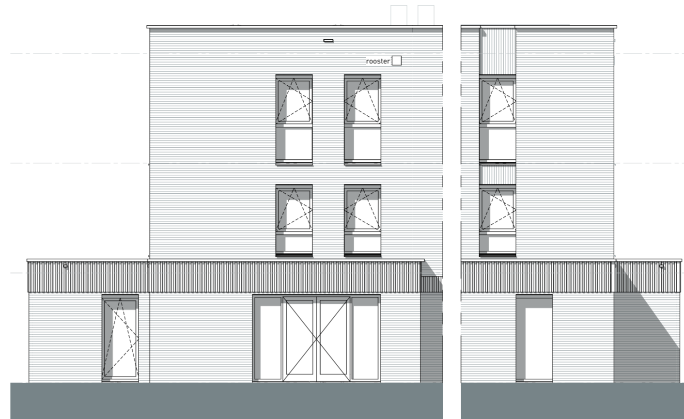
AANBOUW + 1800mm ACHTERGEVEL - TYPE B2 Bouwnr: 95